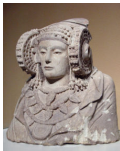
La Dama de Elche (actualmente en el Museo Arqueológico Nacional – Madrid)